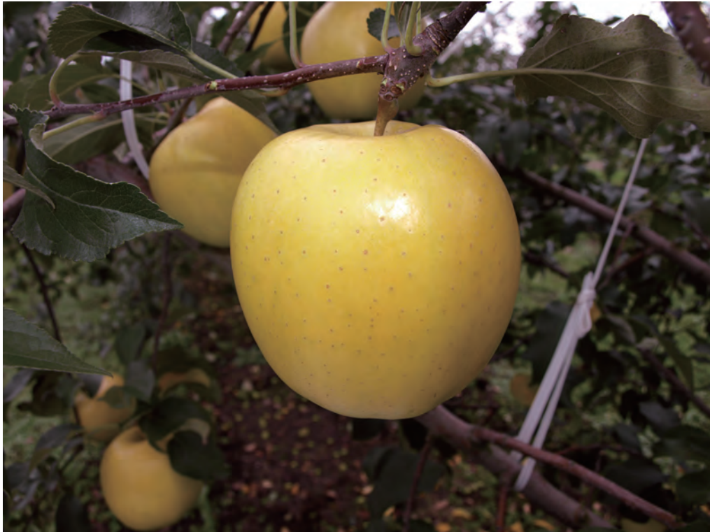
Fig. 2 Fruit of 'Morinokagayaki' .