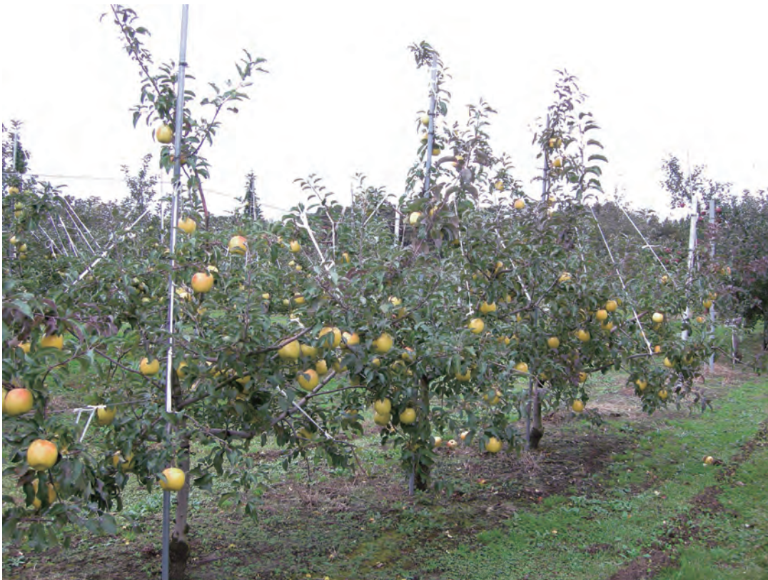
Fig. 3 Bearing tree of 'Morinokagayaki' on JM1 (7 years old).